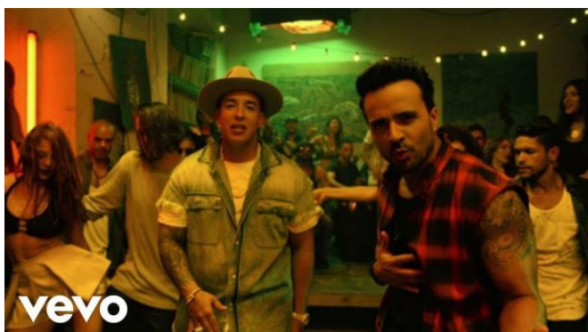
Fig. 5: Miniatura del videoclip oficial de Despacito.

Para el año 2017 saldría la canción más famosa de reggaetón que se ha visto jamás, con la gasolina se dio un despegue a este género, pero con la canción Despacito 28 de Luis Fonsi se alcanzaría un culmen y una madurez para este género. La canción acumula casi 8 mil millones de reproducciones consultadas en youtube a día de hoy y se puede decir con seguridad que la canción ha recorrido el mundo literalmente.