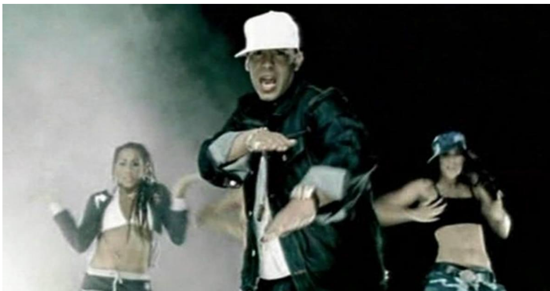
Fig. 4: Fotograma del videoclip oficial de la Gasolina de Daddy Yankee.

Para el año 2004 la canción Gasolina 23 de Daddy Yankee habría traspasado todas las fronteras y habría llegado a muchas partes del mundo calando en España de una manera que nunca se había visto. Con esta canción se empezó a consolidar el género del reggaetón cómo una de las formas dominantes de la nueva ola de la música urbana.