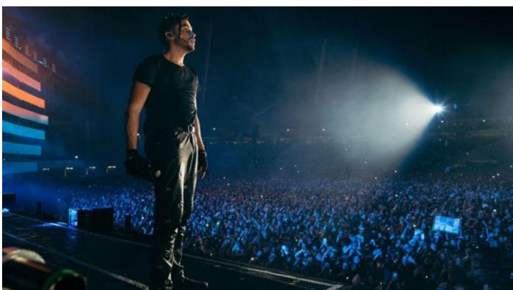
Fig. 6: Concierto de Bad Bunny en Quito.

El trap puede fusionar y mezclar géneros cómo el hip hop, el rap y el dubstep 32 y efectivamente viene pisando fuerte en las generaciones más jóvenes que se nutren de esta música por sus letras fuertes y con contenidos inspirados en la calle. El género cómo tal nació en la década de los 90 en Estados Unidos, en la parte sur y luego se fue extendiendo a Centroamérica y el trap se basaba mucho en su nacimiento en usar los ritmos hip hop, junto a la música electrónica, el género no se popularizó hasta bien entrado el siglo XXI. De hecho no fue hasta el año 2012 que empezó a generar más búsquedas e interés, a la vez que empezó a decaer el interés y las búsquedas para el hip hop, pues al ser el trap una fusión del hip hop con otros géneros era cuestión de tiempo que el hip hop empezara a decaer. Lo que hizo fresco y moderno al trap fue la incorporación de elementos que ya tenía el reggaetón, cómo unas letras de trapicheos de drogas, alcohol y sexo mezcladas con las ganas de fiesta, de bailar, de ligar. Otro de los elementos que incorporó fue el autotune, el invento tan popular para distorsionar y afinar la voz, recordando que los artistas de reggaetón y trap no tenían tan buena voz para cantar y afinar en sus composiciones. Sus objetivos se basaban en un ritmo para bailar de fiesta y en una letra directa que la gente entendiera, dejando atrás el perfeccionismo de la voz o la melodía (¿Que es el trap y porque ha conquistado a los jóvenes?, 2018).