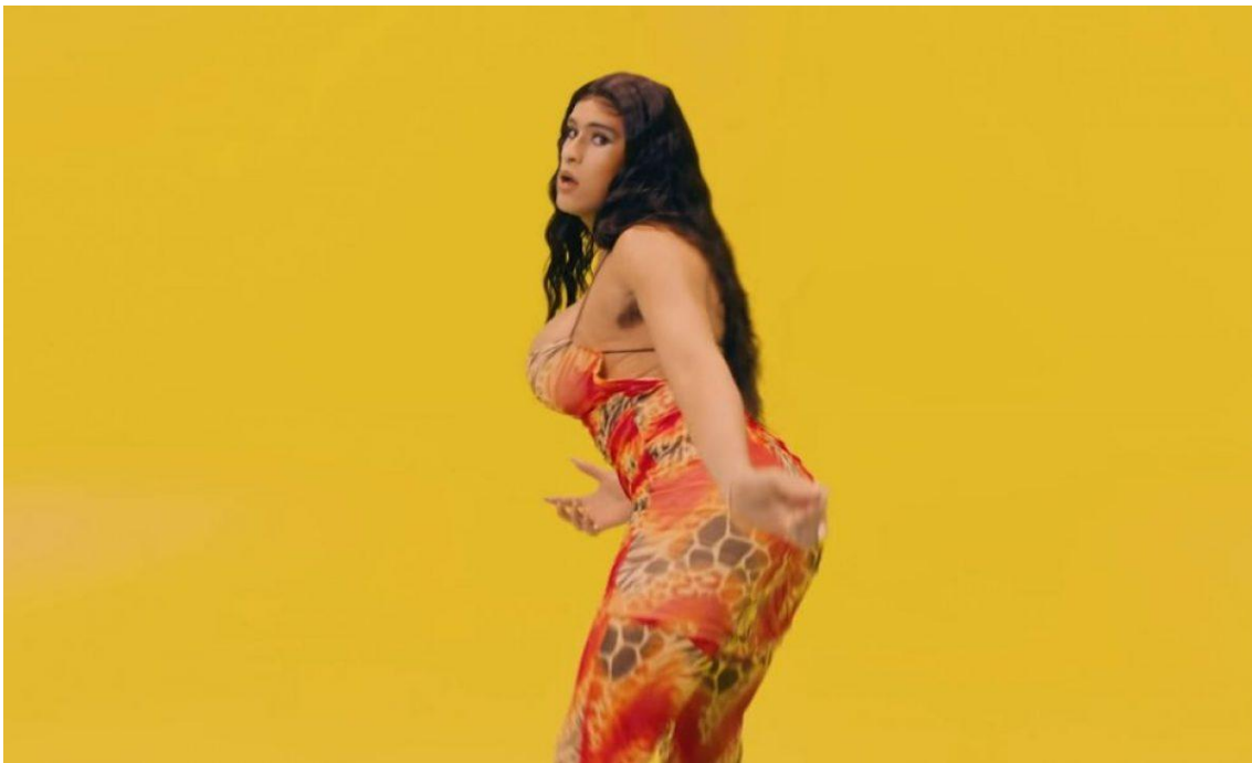
Fig 7: Bad Bunny en su videoclip “Yo perreo sola”.

peinados vistosos. En los videos de este cantante se tiende también a sexualizar a las mujeres, a imponer esos estereotipos. En este videoclip en concreto las mujeres van con vestidos que marcan la cintura y el escote o con pantalones muy cortos y su objetivo es el de arropar al artista y atenderle mientras canta. Los movimientos del artista son escasos, se basan mucho en el movimiento de las manos y en las poses al sujetar una copa. Por eso está vestido tan llamativo, para compensar los escasos bailes o movimientos que hace. En otros videos de años más posteriores Bad Bunny sí intenta acercarse más al feminismo de la mujer, a la igualdad entre los dos géneros en sus intentos de letras menos directas y más maduras. E incluso en otros videoclips se viste de mujer cómo una manera de acercar posturas hacia el feminismo, pero lo vuelve a hacer con esos estereotipos impuestos, mostrando unos pechos exuberantes y grandes curvas.