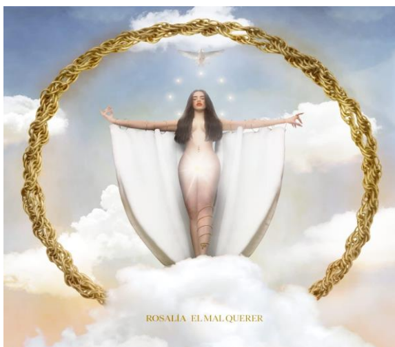
Fig 10: Portada del Mal Querer .

En 2018 empezó a dar un adelanto de su nueva creación y los singles que precedieron al álbum fueron muy positivamente valorados y alcanzaron una repercusión que la artista no esperaba, a finales de este mismo año fue cuando sacó a la luz todo su álbum El mal querer , ese trabajo conceptual en el que había estado trabajando, el disco estaba formado por 11 canciones y cada canción representa un capítulo, cómo si contase una historia completa cada canción. La historia completa del disco narraba una relación tóxica y cómo la persona se va dando cuenta de esa relación insana hasta que sale por fin liberado de esa mala relación. Es un disco también de empoderamiento femenino, aunque puede ser de empoderamiento a cualquier persona que escapa de una relación tóxica en busca de un amor verdadero. Incluso la portada se puede considerar como un símbolo de empoderamiento femenino por la imagen que muestra, de Rosalía cómo si fuera una diosa que alcanza los cielos.