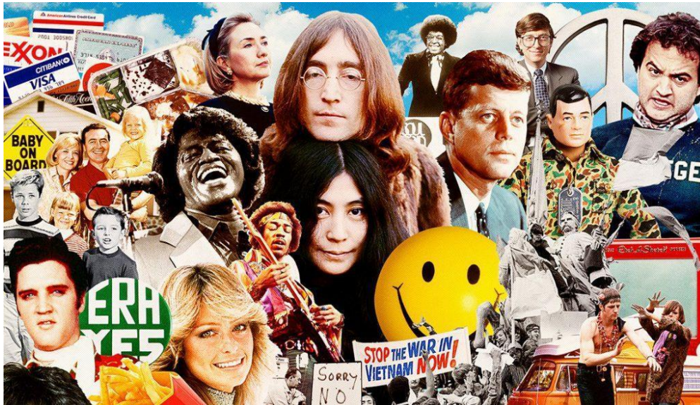
Fig. 3: Representación de la apertura de España en 1960.

Para la década de los 80 nacieron una nueva generación de artistas encargados de fusionar nuestra música con las influencias que vienen desde fuera. Estos artistas literalmente tenían más interés por las músicas populares urbanas. En España durante esta época se daría la movida madrileña 22 dónde se veía el esplendor de artistas como Pata negra, Ketama y Ray Heredia fusionando el rock, el blues y el pop con el flamenco (La fusión flamenca, el nuevo flamenco y el flamenco hoy, s.f.).