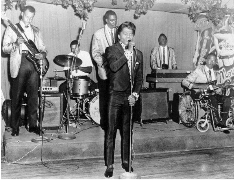
Fig. 2 : James Brown en el escenario junto a su banda.

En toda su evolución el R&B ha tomado varias formas de denominarse según iba evolucionando. Durante las primeras olas de este género en la década de los 60 tomaba el nombre simplemente como Blues electrónico debido a las guitarras, bajo y piano eléctrico. Era un género muy pionero en el sonido eléctrico ya que los instrumentos eléctricos o enchufados a un amplificador y altavoces se empezaron a concebir en los años 20 y la aparición de este género fue a finales de los 30. En la década de los 70 el género empieza a fragmentarse, va perdiendo su identidad, aquello que lo hace especial, dando lugar a la agrupación de estilos como el soul 19 o el funk 20 que basan su estilo en la profundización con los instrumentos eléctricos, por ejemplo, en el caso del funk se puede observar un sonido muy característico de guitarra y bajo que le dan ese toque para que la pieza musical sea considerada funk. En el caso del soul tenía más precisión el ritmo de la batería, que se acentuaba con palmas (Romero, 2019).