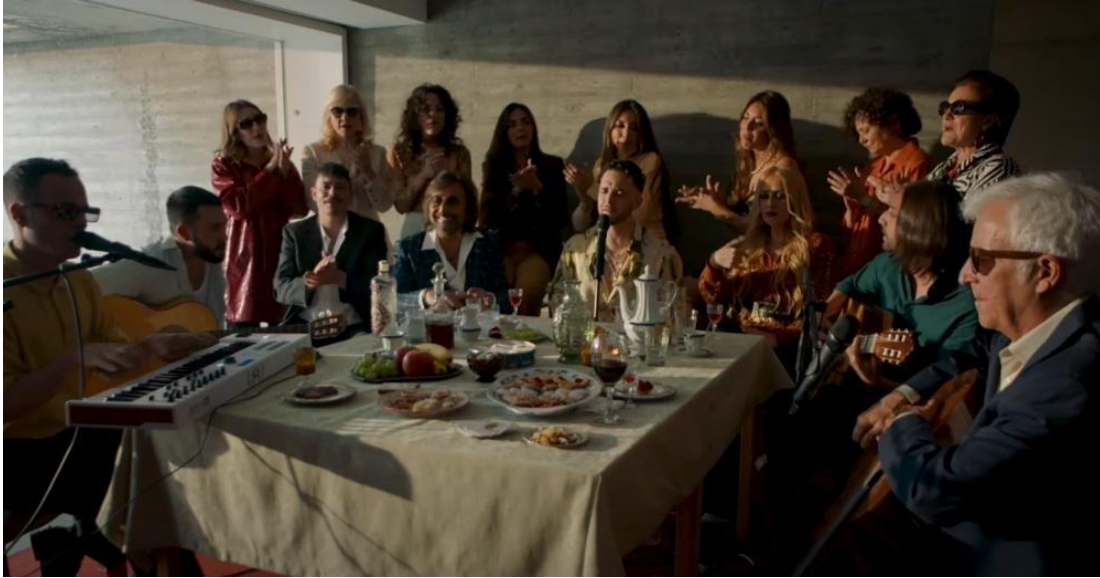
Fig 9: Espectáculo Tiny Desk de C.Tangana.