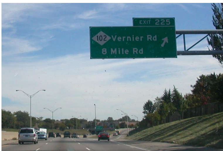
Fig. 1 : Carretera 8 Mile.

de un conocido abusón de su escuela. Eminem cayó en coma durante 10 días y tuvo que esperar 2 años para recuperarse del todo (Draw my life en español, 2016).