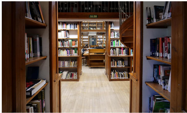
Biblioteca del Colegio Máximo