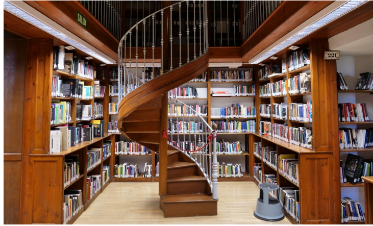
Biblioteca del Colegio Máximo