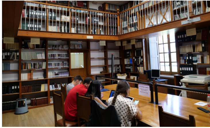
Biblioteca Colegio Máximo