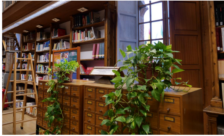
Biblioteca del Colegio Máximo