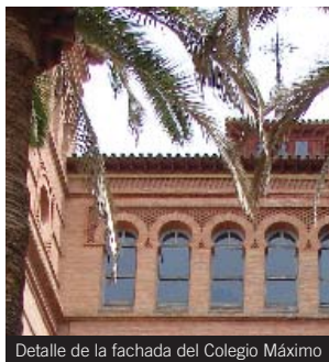
Detalle de la fachada del Colegio Máximo

Líneas: Acceso al Campus de Cartuja: U1, U2 y U3.